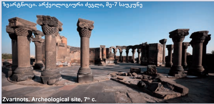
Zvartnots. Archeological site, 7 th c.

იკომოს სომხეთი იკომოს სომხეთი არის ძეგლებისა და ღირსშესანიშნავი ადგილების საერთაშორისო საბჭოს სომხეთის ეროვნული კომიტეტი. სომხეთის იკომოსი არის 2002 წელს დაარსებული არასამთავრობო ორგანიზაცია, რომელიც იღვწის კულტურული მემკვიდრეობის ძეგლების კონსერვაციის, დაცვისა და რეაბილიტაციისათვის. ორგანიზაცია აერთიანებს 70 პროფესიონალს, მათ შორის ახალგაზრდა პროფესიონალებს.