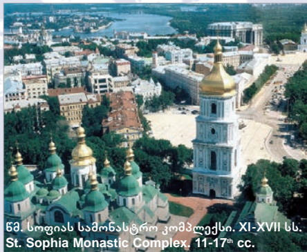
წმ. სოფიას სამონასტრო კომპლექსი. XI-XVII სს. St. Sophia Monastic Complex, 11-17 th cc.

„არქიტექტურა და პრესტიჟი“ 1994 წელს დაარსებული კერძო კომპანიაა, რომელმაც დიდი გამოცდილება მიიღო პოსტ-საბჭოთა რეალობაში პრაქტიკული ურბანული დაგეგმარების, არქიტექტურული და ინტერიერის დიზაინის, განსაკუთრებით კი ისტორიული და ბუნებრივი მემკვიდრეობის სფეროებში. ამავდროულად, პოსტ-საბჭოთა სივრცესა და ეპოქაში