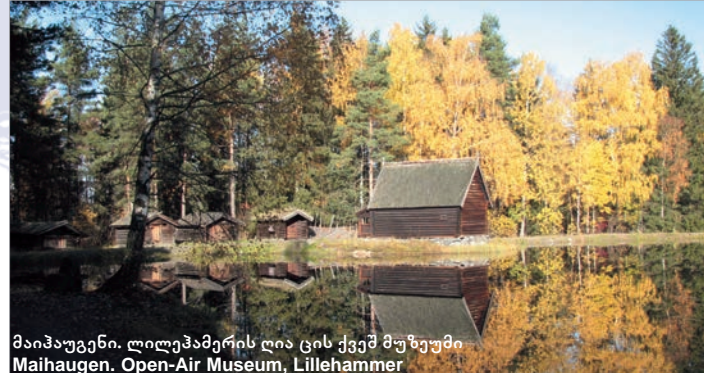
მაიჰაუგენი. ლილეჰამერის ღია ცის ქვეშ მუზეუმი Maihaugen. Open-Air Museum, Lillehammer

ნორვეგიის კულტურული მემკვიდრეობის დირექტორატი ნორვეგიის კულტურული მემკვიდრეობის დირექტორატი – რიკსანტიკვარენი პასუხისმგებელია ნორვეგიის კულტურული მემკვიდრეობის აქტის და ნორვეგიის პარლამენტის მიერ დამტკიცებული მიზნების პრაქტიკულ განხორციელებაზე. დირექტორატი ექვემდებარება ნორვეგიის გარემოს სამინისტროს და თანამშრომლობს მასში შემავალ სხვა დირექტორატებთან. საერთაშორისო თანამშრომლობა რიკსანტიკვარენის სტრატეგიაში განსაზღვრული ერთ-ერთი მიზანია. საერთაშორისო თანამშრომლობის გზით რიკსანტიკვარენს აქტიური წვლილი შეაქვს კაცობრიობის კულტურული მემკვიდრეობის დაცვის საქმეში და ხელს უწყობს კულტურული უფლებებისა და კულტურული მრავალფეროვნების გაძლიერებას.