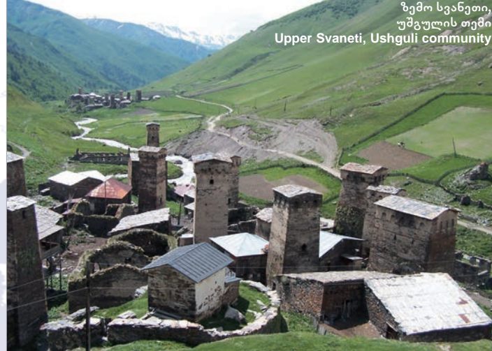
ზემო სვანეთი, უშგულის თემი Upper Svaneti, Ushguli community

Norwegian Directorate for Cultural Heritage – Riksantikvaren The Directorate for Cultural Heritage – Riksantikvaren is responsible for the practical implementation of the Norwegian Cultural Heritage Act and the objectives, laid down, by the Norwegian Parliament (Stortinget). Riksantikvaren comes under the environmental management umbrella, and answers to the Ministry of the Environment. Riksantikvaren collaborates with other directorates in the environmental sector wherever appropriate. International Activities – Working in an international perspective is one of the aims stipulated in the strategy of Riksantikvaren. Through international co-operation Riksantikvaren actively contributes towards safeguarding the cultural heritage of mankind, including cultural rights and cultural diversity.